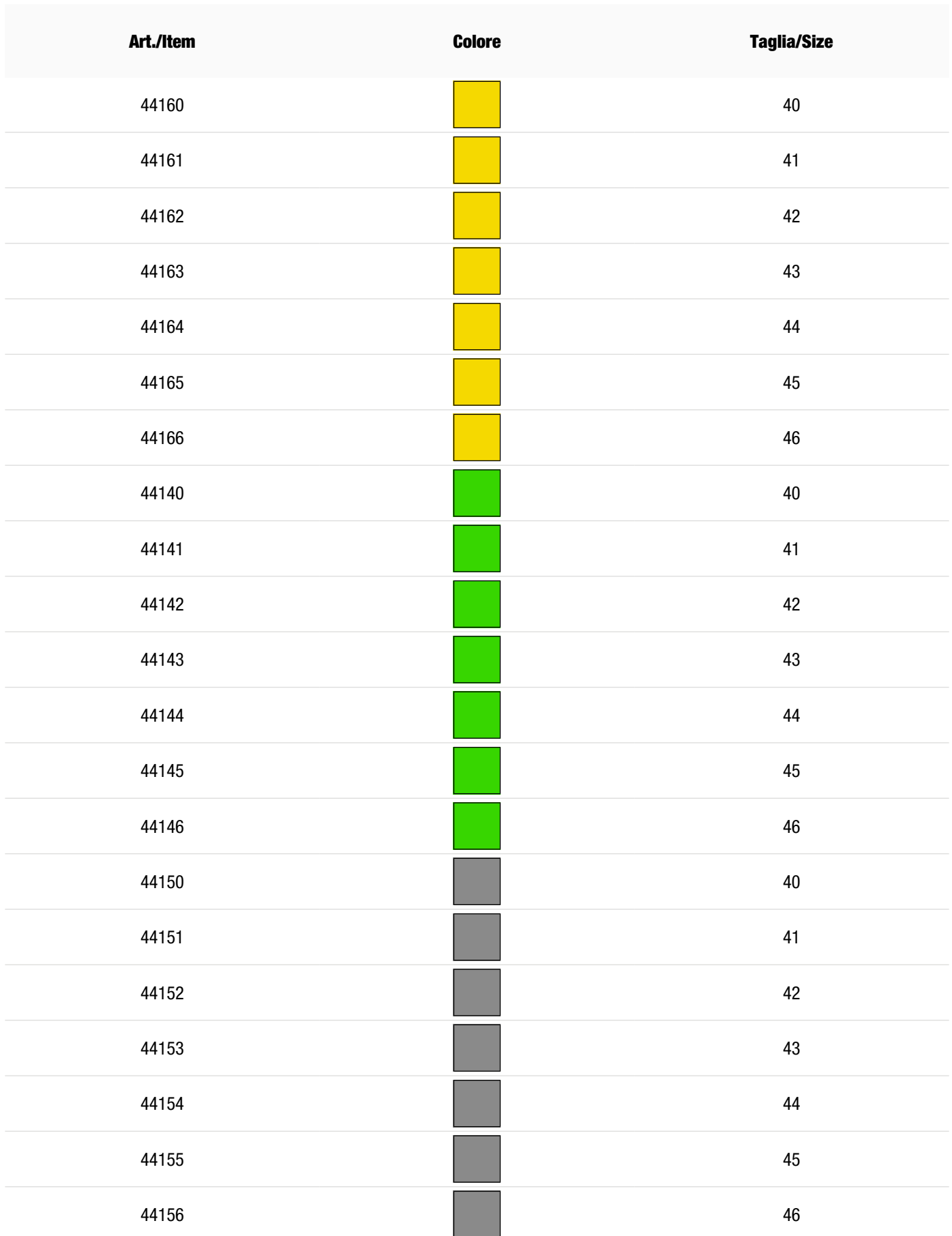
Tabella varianti articolo