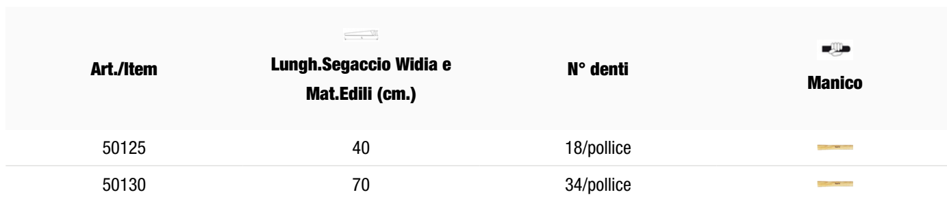
Tabella varianti articolo